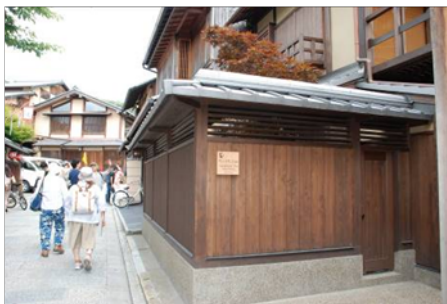
花とうろ Stay Yasakano Tou Machiya

八坂の塔近辺には高級っぽいゲストハウスが点在し、玄関はテンキーに番号を入力して開閉するようです。看板には「花とうろStay Yasakano Tou Machiya」と書かれていました。