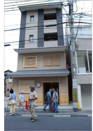
ゲストハウス「エムズイン東山」

⑩五条通の南側に目をやると、古い府営住宅が無くなり、白いフェンスで囲われています。ここにもホテルが建設されるのではないかと噂されています。